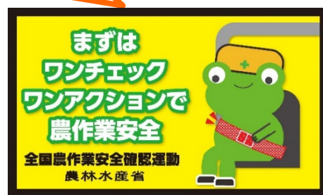
平成31年農作業安全ステッカー

参加いただいた生徒さん、先生方に 記念品 として 農作業安全ステッカー をお渡しします